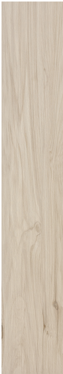
20x120 cm (8x48) KM.KR.APP.0848