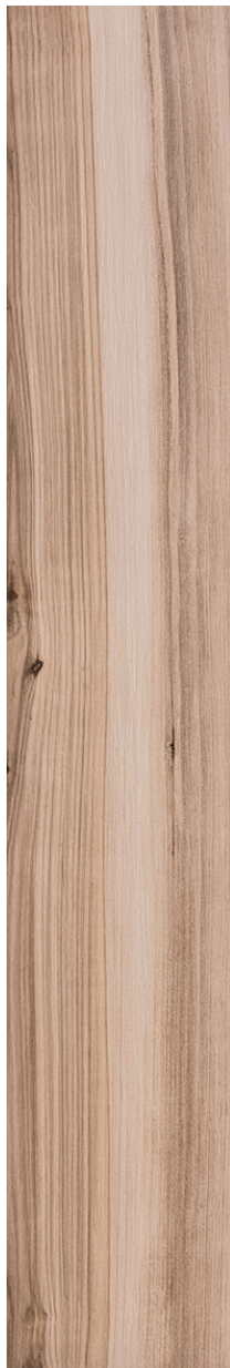
20x120 cm (8x48) KM.KR.APT.0848