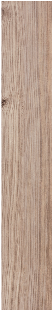
20x120 cm (8x48) KM.KR.PCH.0848