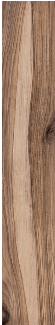
20x120 cm (8x48) KM.KR.NUT.0848

Tous les items présentés dans ce document font partie du programme d'inventaire Olympia. Pour les commandes spéciales, veuillez contacter votre représentant de Tuiles Olympia.